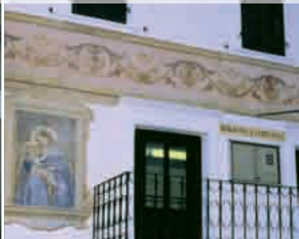
BIBLIOTECA di TELVE