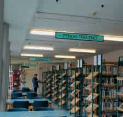
BIBLIOTECA di BORGIO VALSUGANA