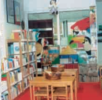
BIBLIOTECA di GRIGNO