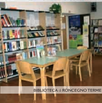
BIBLIOTECA di RONCEGNO TERME