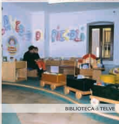
BIBLIOTECA di TELVE