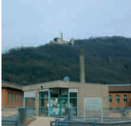
BIBLIOTECA di BORGO VALSUGANA