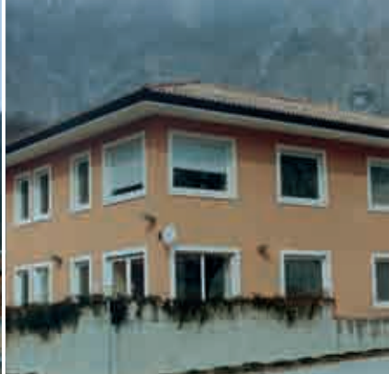
BIBLIOTECA di GRIGNO