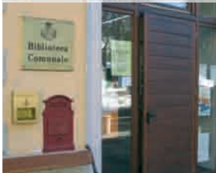
BIBLIOTECA di RONCEGNO TERME